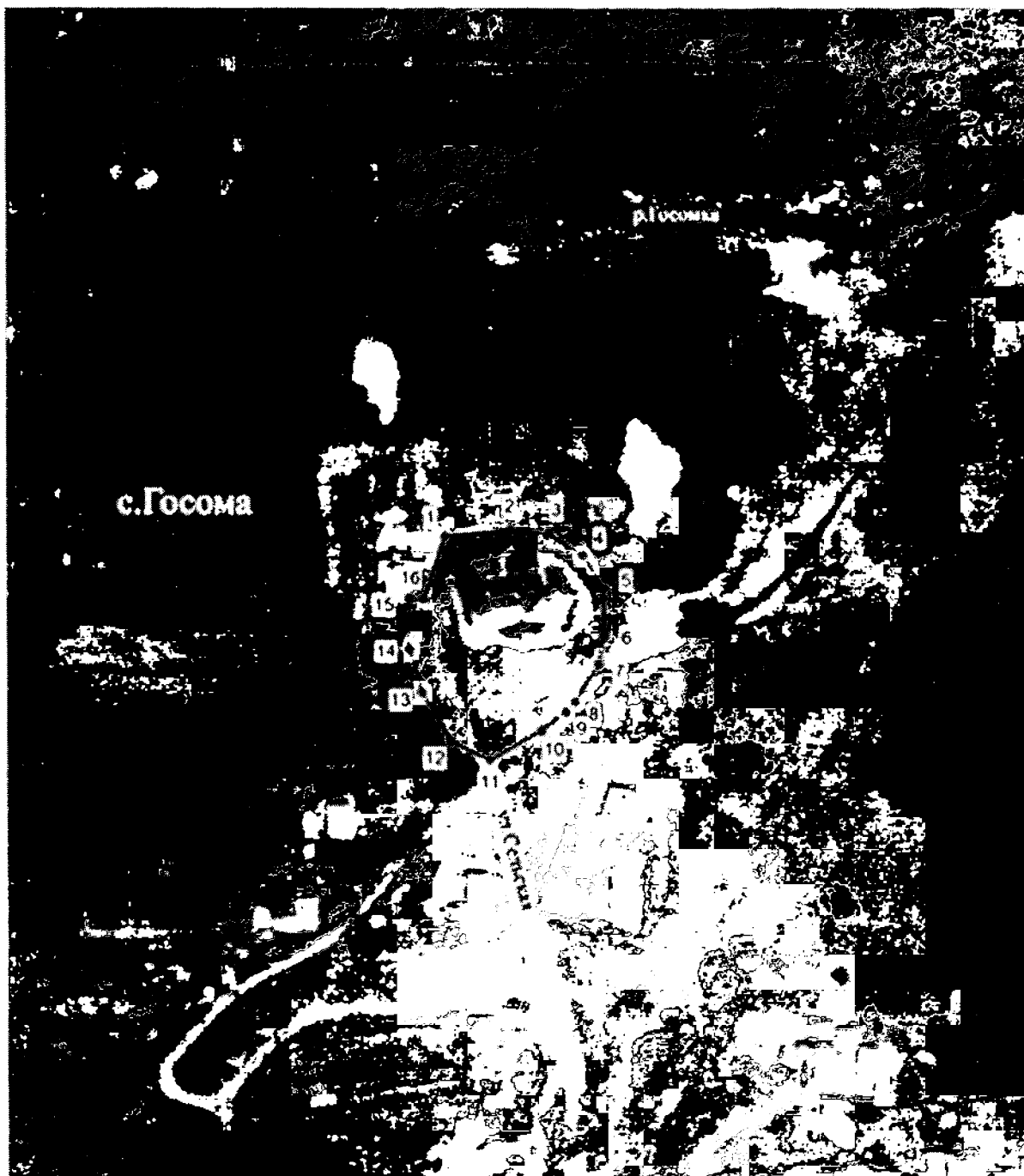
Схема границ территории объекта культурного наследия регионального значения «Церковь Бориса и Глеба»